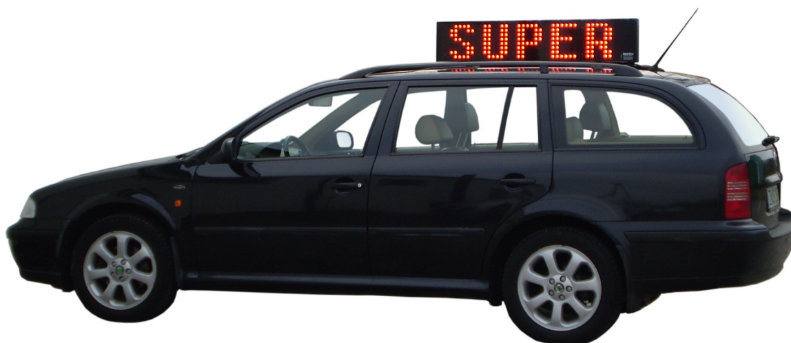
Model NCX 520R na dachu samochodu

NESTEC technologie led – pierwszy polski producent z rozsądnymi cenami