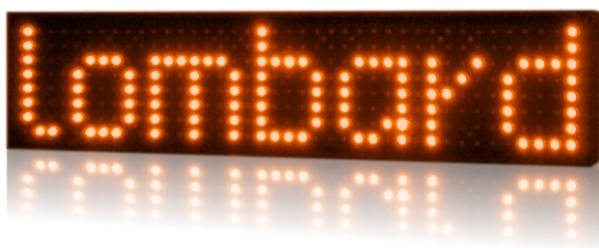
model PROFI+ 520