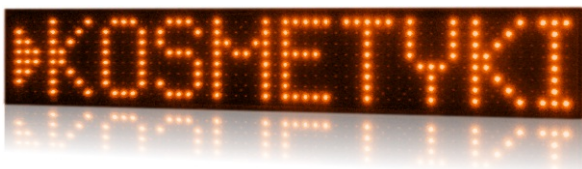
model PROFI+ 720