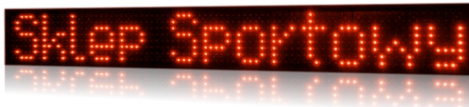
model PROFI+ 1020