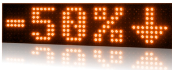
model PROFI+ 520