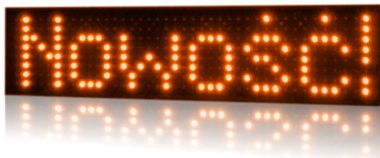
model PROFI+ 520

Program pozwala również na wprowadzanie do animacji dodatkowych znaków i symboli, jak telefon, euro, czy strzałki. Informacje w postaci daty, godziny i temperatury wprowadza się w dowolnym momencie w bardzo prosty sposób – jednym kliknięciem w odpowiednią ikonkę. Dla ułatwienia, przed wysłaniem do wyświetlacza, animację można obejrzeć na podglądzie.