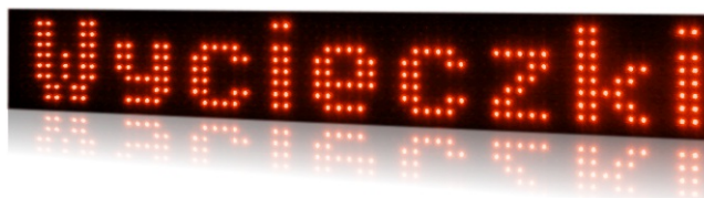
model PROFI+ 820